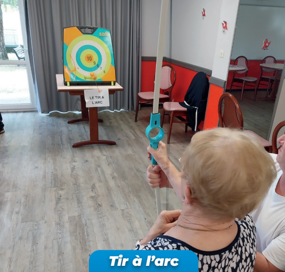
Tir à l'arc