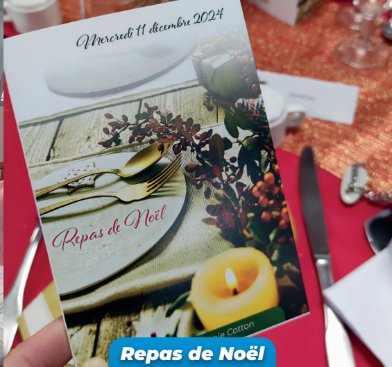
Repas de Noël