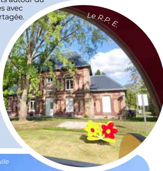
La crèche Lilibulle

Sans oublier la piscine Alex Jany et les associations sportives qui proposent des activités spécifiques pour tout-petits. La liste est à consulter dans le guide des associations en ligne sur le site de la mairie : https://grand-couronne.fr