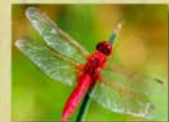
La libellule écarlate Celle-ci est sûre de ne pas passer inaperçue.