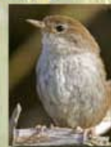
La bouscarle de Cetti

Notez bien : leur plumage est discret, de manière à se confondre au mieux dans la roselière.