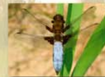
La libellule déprimée Elle doit son nom à la dépression de son abdomen.