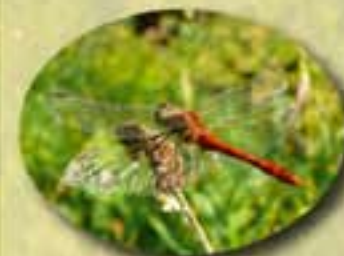
Le sympétrum strié Ses pattes sont striées de jaune et son thorax bicolore.