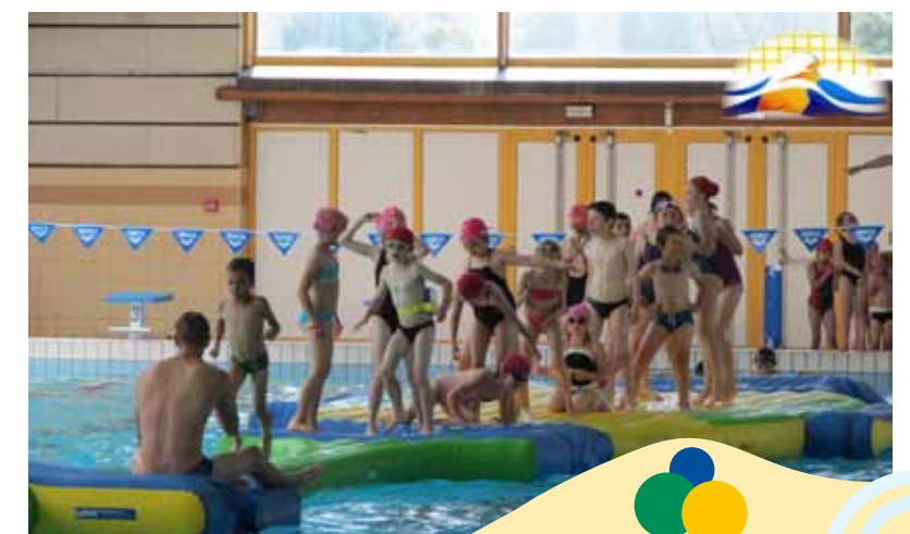
Centre Aquatique Alex Jany