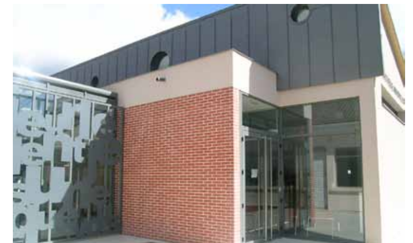
Médiathèque Boris Vian

Parce que l'été est le moment de la détente, rien de tel qu'un bon bain et un bon livre... Après son grand nettoyage annuel, la réouverture du Centre Aquatique le 6 juillet ravira petits et grands. D'ailleurs, la canicule annoncée devrait inviter les familles à investir ce lieu plébiscité des Grand-Couronnais. Comme chaque année, des stages de natation pour les enfants sont mis en place pour juillet et août. Enfin, les mardis après-midi du mois de juillet, les plus jeunes pourront s'amuser sur les structures gonflables laissées à disposition. Mais le Centre Aquatique offre aussi un bel espace de verdure où il fait bon "farnienter". L'occasion aussi de lire un bon livre... Dans un cadre agréable, la Médiathèque Boris Vian vous propose différents médias. Ainsi, plus de 23 000 livres et revues, 4 000 CD de musique sont à votre disposition. Vous pouvez, de chez vous, avoir accès aux catalogues en ligne, rechercher des livres ou des CD, consulter votre compte ou réserver des ouvrages. En somme de quoi passer un bel été !