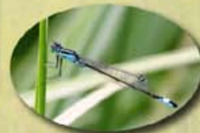
Un agrion Les agrions sont toute une famille. Ici l'agrion élégant.